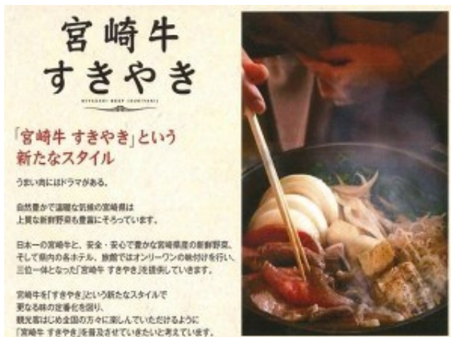
宮崎牛すきやき会席コースイメージ