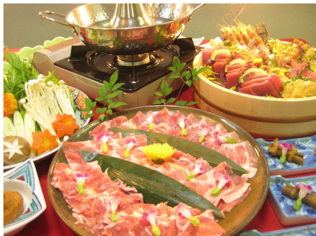
宮崎ブランドポークしゃぶしゃぶ会席