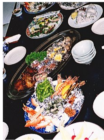
会場レイアウト参考例