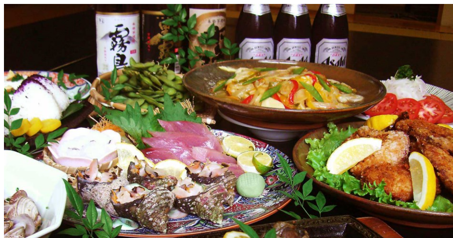
卓盛料理イメージ