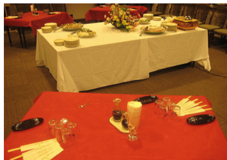
会場レイアウト参考例