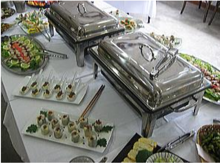
立食ビュッフェ料理イメージ