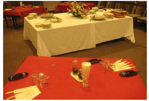
会場レイアウト参考例