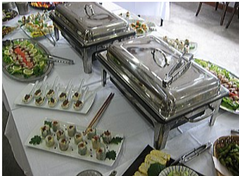
パーティー料理イメージ

4,500円コース【飲み放題2h込】 ※平日（日～木曜日。休前日は除く） は4,000円！10名様から最大60名様収容可